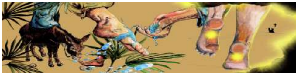
Illustratie: Tynke Van Schaik